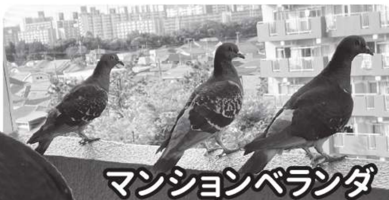
マンションベランダ