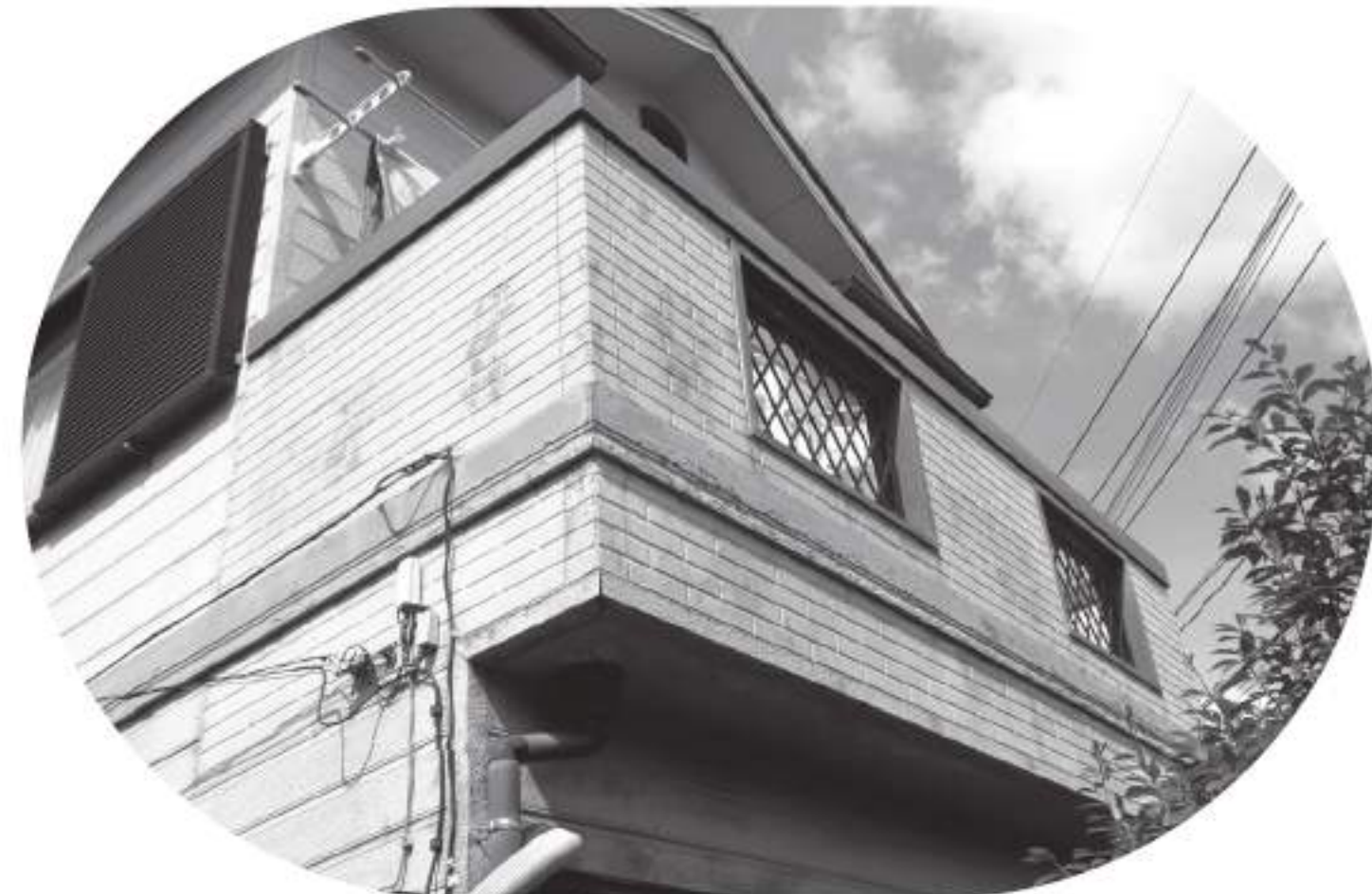
ベランダからの雨漏り