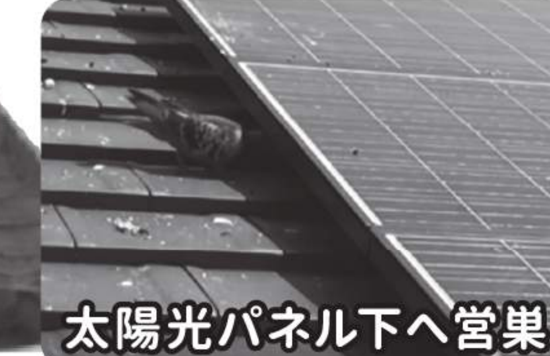
太陽光パネル下へ営巣